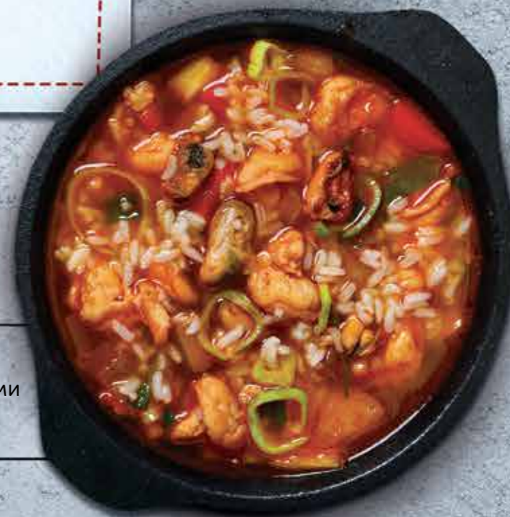
РИС с морепродуктами 450 г / 340.-